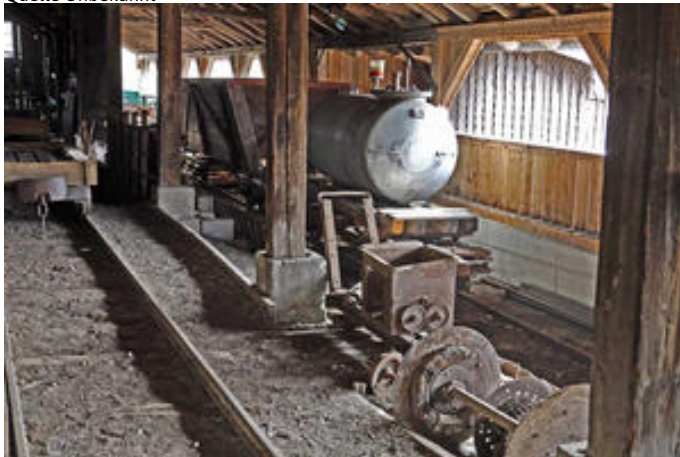
Autor Unbekannt Quelle Chiemsee-Alpenland Tourismus