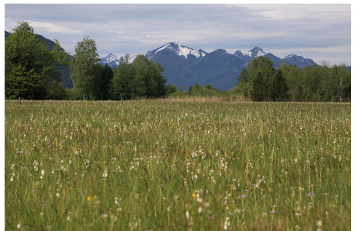
Autor Unbekannt Quelle S. Kattari / Ökomodell Achental