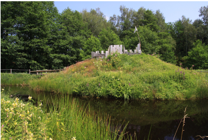
Autor Unbekannt Quelle S. Kattari / Ökomodell Achental