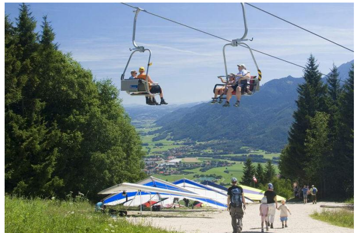
Hochplattenbahn Autor Unbekannt Quelle Unbekannt