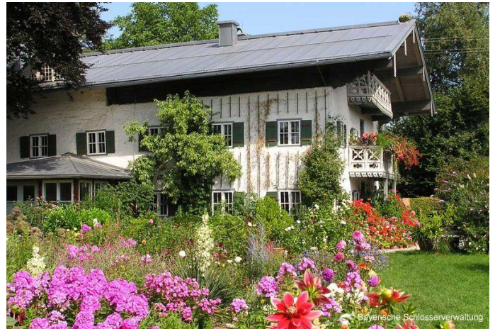
Künstlerhaus Exter Autor Unbekannt Quelle Unbekannt