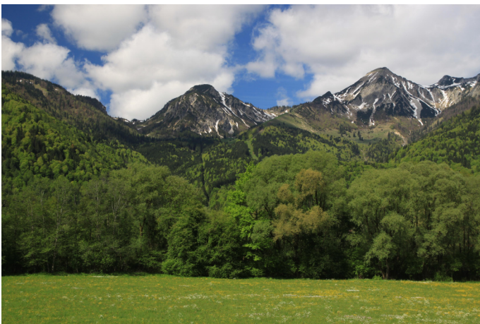
Autor Unbekannt Quelle S. Kattari / Ökomodell Achental