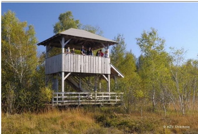
Aussichtsturm Kendlmühlfilzen, Grassau