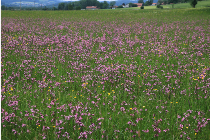
Autor Unbekannt Quelle S. Kattari / Ökomodell Achental