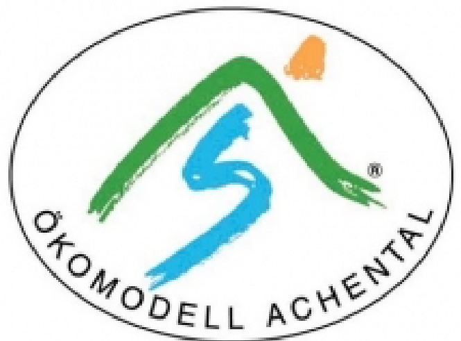
Wegekennzeichen Achental-Radweg