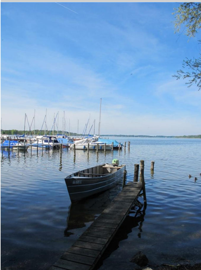
Anlegestelle am Chiemsee