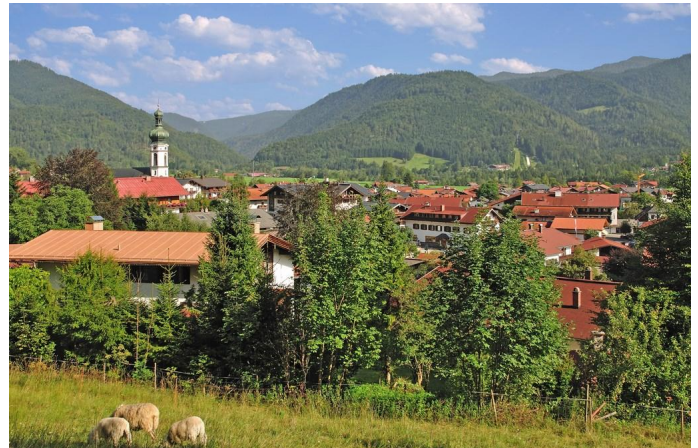
Ausblick auf Reit im Winkel