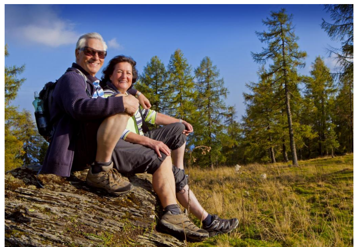
Wanderer bei einer Rast